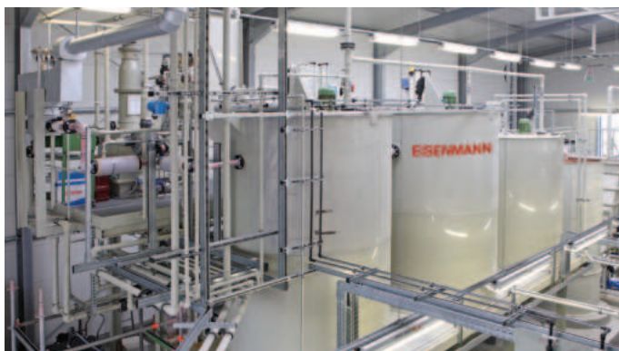
Anlage zur Pestizidbehandlung.