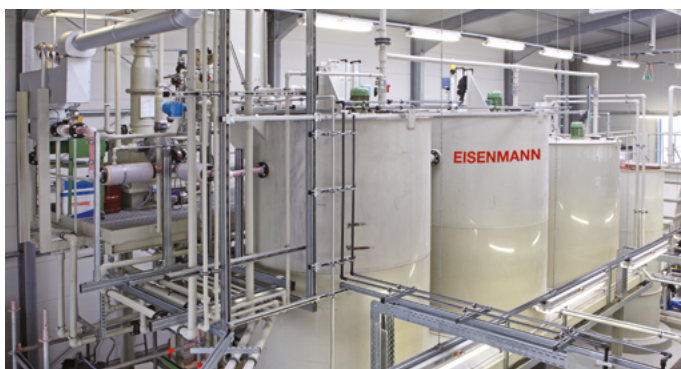
Anlage zur Pestizidbehandlung.